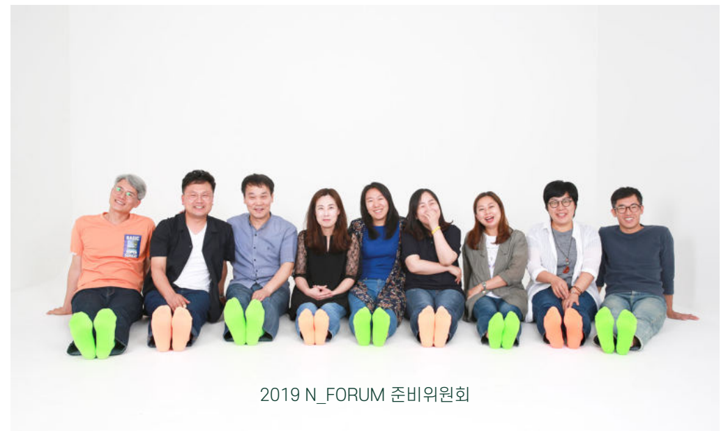
2019 N_FORUM 준비위원회