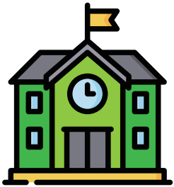
아산 유스프러너와 함께한 학교