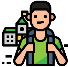
아산 유스프러너와 함께한 학생