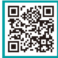
라이브러리 바로가기 (로그인 후 다운로드 가능)

아산 기업가정신 스쿨 라이브러리를 통해 아산나눔재단 기업가정신 교육의 히스토리와 경험이 담긴 다양한 자료를 만나보세요!